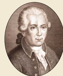
Georg Christoph Lichtenberg