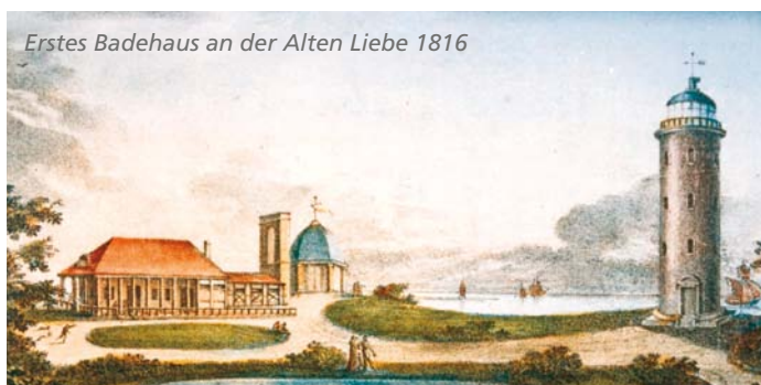
Erstes Badehaus an der Alten Liebe 1816